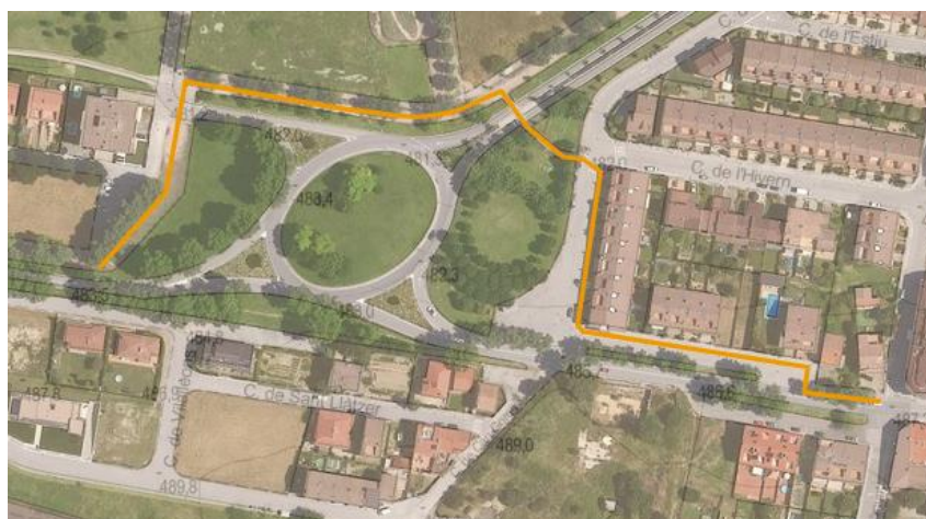
Imatge 3. Recorregut entre Sant Llàtzer i el final de la carretera de Sant Hilari Sacalm

Com s'ha apuntat anteriorment, des que existeix la rotonda entre Sant Llàtzer, les Quatre Estacions i Calldetenes, existeix una forta discontinuïtat en l'itinerari a peu al llarg de la carretera de Sant Hilari Sacalm a banda i banda de la rotonda. Concretament, la configuració actual de l'entorn de la rotonda implica que l'itinerari que cal fer des del final del passeig paral·lel a la N-141d de Sant Llàtzer fins la cruïlla de la carretera de Sant Hilari Sacalm i el carrer de la Primavera (Vic) i el carrer Gran i el carrer de Bellmunt (Calldetenes) és d'uns 480 metres, quan en línia recta la separació entre els dos punts és de 325 metres. Aquest increment proper al 50% de la distància necessària a recórrer il·lustra la problemàtica falta de permeabilitat de l'esmentada rotonda. La imatge 3 mostra el recorregut en qüestió.