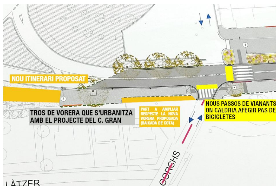
Imatge 10. Actuacions complementàries suggerides a l'entorn de la cruïlla ctra. St. Hilari Sacalm-c. Bon Aire-camí de Can Gorchs, sobre el plànol del projecte de reurbanització del carrer Gran de Calldetenes

L'habilitació de l'itinerari compartit per a vianants i bicicletes que es proposa concreta el punt 7 de l'actuació 1.4 "Resoldre el punt més crític d'accessibilitat de cada barri" del Programa d'Actuacions del Pla de Mobilitat Urbana Sostenible (PMUS) de Vic recentment aprovat, relatiu genèricament a fer la rotonda més permeable pels vianants, creant itineraris accessibles, per tal que no suposi un obstacle . En la mateixa línia, el PMUS proposa la creació d'un eix de convivència al llarg de tota la carretera de Sant Hilari Sacalm fins al límit amb el terme municipal de Calldetenes a la cruïlla amb el carrer de Pere Mateu, igual que la classifica com a part de la xarxa ciclable principal, en ambdós casos sense fer cap mena de rodeig a la rotonda.