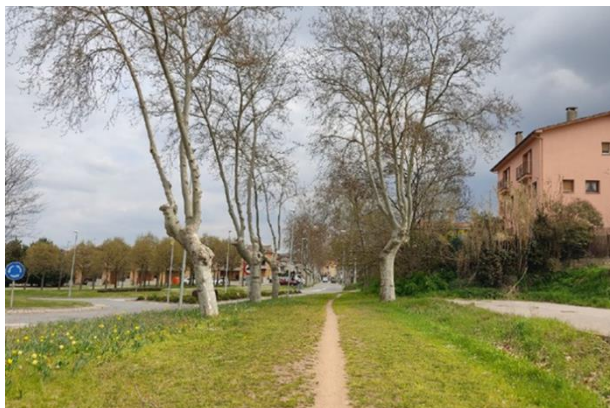
Imatge 5. Camí fresat a l'antiga traça de l'N-141d