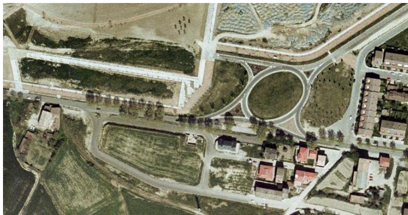
Imatge 2. Vista aèria (2001).