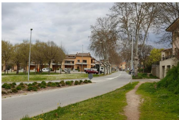
Imatge 6. Camí fresat a l'antiga traça de l'N-141d

Pel que fa a la mobilitat en bicicleta, l'elevada intensitat de trànsit de vehicles motoritzats (especialment, de camions) a la carretera N-141d fa que la gran majoria d'usuaris de la bicicleta, especialment aquells que l'utilitzen per fer desplaçaments quotidians o que potencialment podrien fer-ho, utilitzin el passeig paral·lel a la N-141d -classificat com a "Pista ciclable" segons l'Ajuntament de Vic- i no pas la pròpia carretera. Per tant, de nou cal accedir-hi a través del nord de la rotonda (pel carrer de Mercè Font i Codina), el que implica un increment del recorregut si es ve o es va a la part sud de les Quatre Estacions o a Calldetenes pel carrer Gran, a més de la necessitat de transitar per la rotonda junt amb els vehicles motoritzats, la qual cosa desincentiva l'ús de la bicicleta als usuaris amb menys pràctica o potencials. Alternativament, els usuaris de la bicicleta poden transitar per l'interior del parc de les Quatre Estacions per evitar la rotonda, si bé el pas a través d'aquest és estret i hi ha possibilitat d'entrar en conflicte amb vianants. En aquest sentit, també hi ha usuaris de la bicicleta que prenen el camí d'arriscar-se creuant la carretera entre el passeig i l'antiga traça, ja sigui a peu o dalt de la bici, per tal d'escurçar el recorregut.