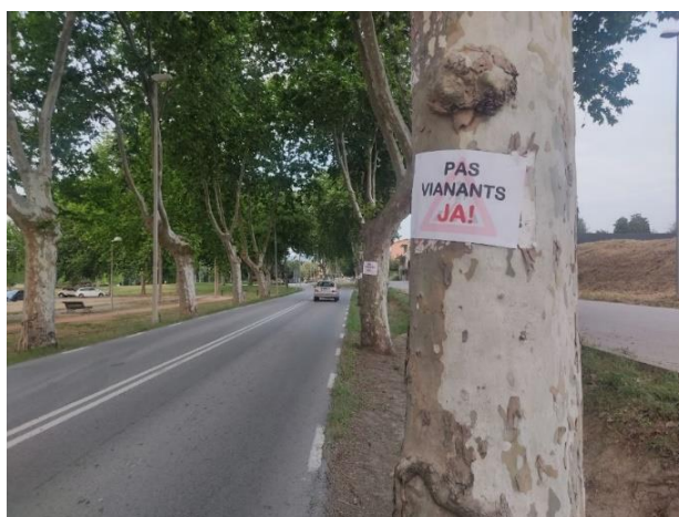
Imatge 11. Cartells que reivindiquen un pas de vianants a l'N-141d a l'extrem de Sant Llàtzer més proper a les Quatre Estacions i Calldetenes

També recentment, les darreres setmanes han aparegut cartells anònims que reivindiquen un pas de vianants a la carretera N-141d, a l'altura on aquesta moció el proposa com a part de l'itinerari (imatge 11).