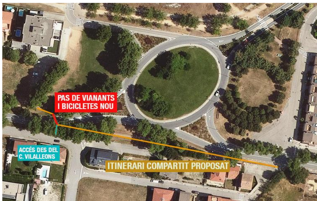
Imatge 7. Representació qualitativa en planta de l'itinerari compartit per a vianants i bicicletes proposat.