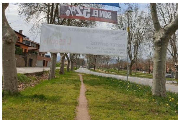
Imatge 4. Camí fresat a l'antiga traça de l'N-141d

El llarg recorregut que cal fer per rodejar la rotonda desincentiva la mobilitat a peu, de manera que potencials vianants passen a utilitzar altres modes de transport que sovint són el cotxe per desplaçar-se entre els nuclis urbans que la rotonda separa. No obstant, altres persones opten per dur a terme la perillosa pràctica de creuar la carretera N-141d (sense cap pas habilitat) per tal de poder seguir l'itinerari més recte i natural, a través de l'espai de l'antiga traça de la N-141d. El camí fresat que es mostra a les imatges 4, 5 i 6 testimonia l'ús recurrent d'aquesta opció arriscada per la seguretat dels vianants.