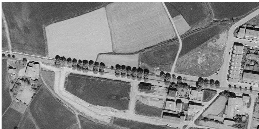
Imatge 1. Vista aèria (1995).

A les dues imatges següents es pot observar el canvi descrit en la configuració del territori entre Sant Llàtzer, les Quatre Estacions i Calldetenes entre 1995 i 2001.