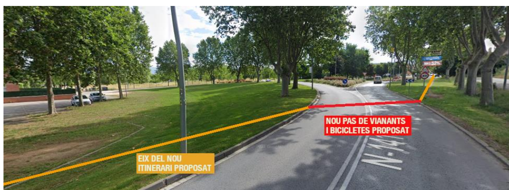
Imatge 8. Representació qualitativa de l'itinerari proposat des de la N-141d a Sant Llàtzer.