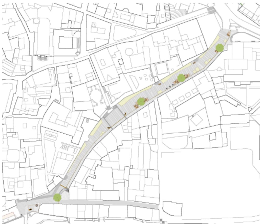
Planta del Projecte després de la incorporació parcial de l'al·legació.

La disposició d'elements verticals a la rambla dels Montcada es veu limitada per la presència de l'únic tram de muralla de la ciutat, on el punt de vista del vianant permet percebre l'alçada de la mateixa, per això mateix la vegetació en alçada s'ha plantejat al costat dels edificis, per a no restar protagonisme a la muralla. Una pèrgola o unes torratxes de la dimensió necessària per al desenvolupament d'arbrat són difícils d'encaixar i en desaconsello la inclusió al projecte.