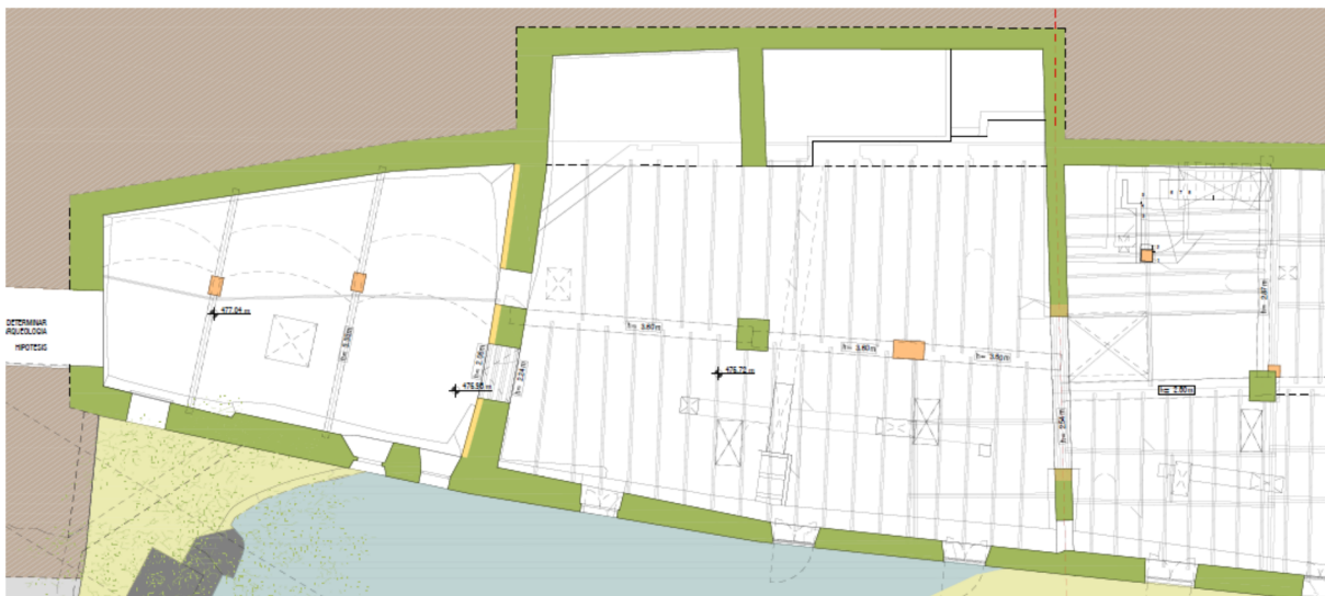
Imatge del semisoterrani de les adoberies, amb les inclusions per sota de la vialitat.

Finalment les primeres adoberies del carrer de les adoberies presenten unes entrades d'uns 3 metres al subsòl del carrer de les adoberies, pel que si el carrer és estret, a nivell de subsòl disponible per al pas de clavegueram encara ho són més.