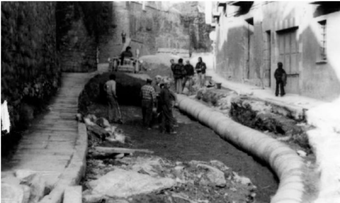
1976. Treballs d'urbanització rambla Montcada. A primer terme s'observen les restes de la fonamentació de la torre de Sant Francesc, enderrocada l'anv 1895.

Finalment les primeres adoberies del carrer de les adoberies presenten unes entrades d'uns 3 metres al subsòl del carrer de les adoberies, pel que si el carrer és estret, a nivell de subsòl disponible per al pas de clavegueram encara ho són més.